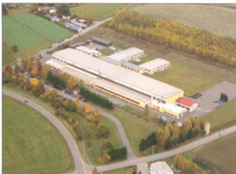
Bild 1: Firmengelände Horn Glass Industries AG in Plößberg bei Tirschenreuth.

Die präzise geformten Steine der großen Glasschmelzwannen, die hohe Temperaturen von rund 1.480 Grad Celsius der Glasschmelze aushalten müssen, planen die Oberpfälzer Spezialisten derzeit noch in 2D. In Zukunft wollen sie diese Formsteine mit