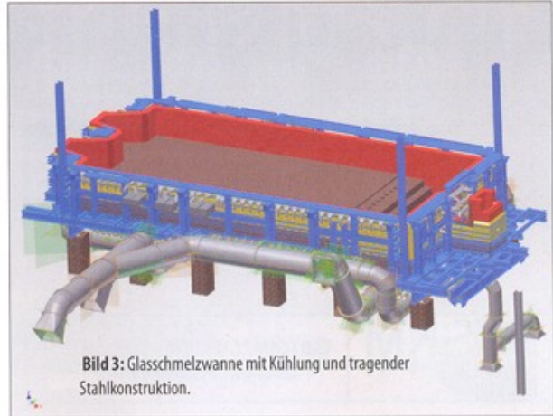
Bild 3: Glasschmelzwanne mit Kühlung und tragender Stahlkonstruktion.

Autodesk Inventor in 3D konstruieren, um Fehler noch besser auszuschließen und Stücklisten automatisch generieren zu können. Das Steinbett wird von einem mächtigen Stahlgerüst getragen und zusammengehalten. Es stützt nicht nur enorme Massen, sondern erträgt auch extreme Temperaturen. Damit das Stahlgerüst nicht davonfließt oder sich verformt – der Schmelzpunkt von Eisen liegt nur wenig höher als der von Glas –, wird die Außenseite der Wanne von Luft umströmt und gekühlt.