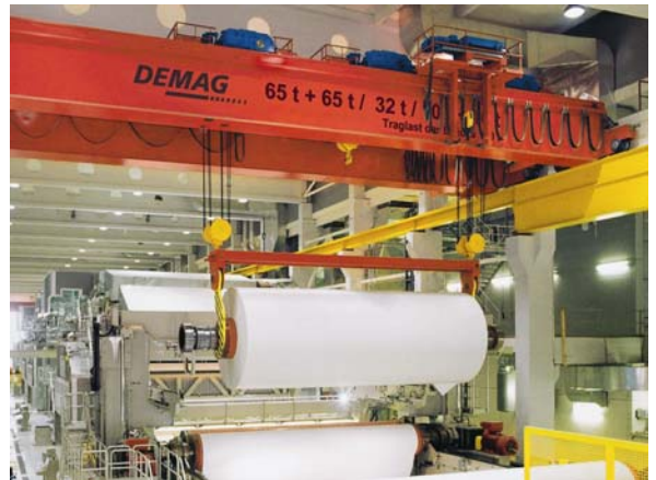
Mechatronik im Kranbau – Um Planungsfehler auszuschließen, arbeiten Mechanik- und Elektrokonstruktion eng zusammen.

Das alte Motto stolzer Maschinenbauer „Was man mechanisch machen kann, fängt man nicht elektrisch an“ ist längst überholt und in der Mottenkiste der Technikgeschichte verschwunden. Die aktuellen Anforderungen an Automatisierung, Komfort und Integration sind ohne die moderne Elektronik und Informatik nicht zu erfüllen. Die Abteilungen, die für die elektrischen Systeme und die Softwareentwicklung zuständig sind, übertreffen bei vielen Maschinenbauern bereits die Größe der Mechanikkonstruktion. Für den gemeinsamen Erfolg ist eine enge Zusammenarbeit der Disziplinen unumgänglich, die mit dem Kunstwort Mechatronik (zusammengesetzt aus Mechanik , Elektronik , Informatik ) bezeichnet wird. Die Mechatronik prägt alle Bereiche, von der Landtechnik bis zur Raumfahrt, von der Medizintechnik bis zur Energiegewinnung. Sie ist die Basis vieler Innovationen, denen der deutsche Maschinenbau seine starke Position im globalen Wettbewerb verdankt.